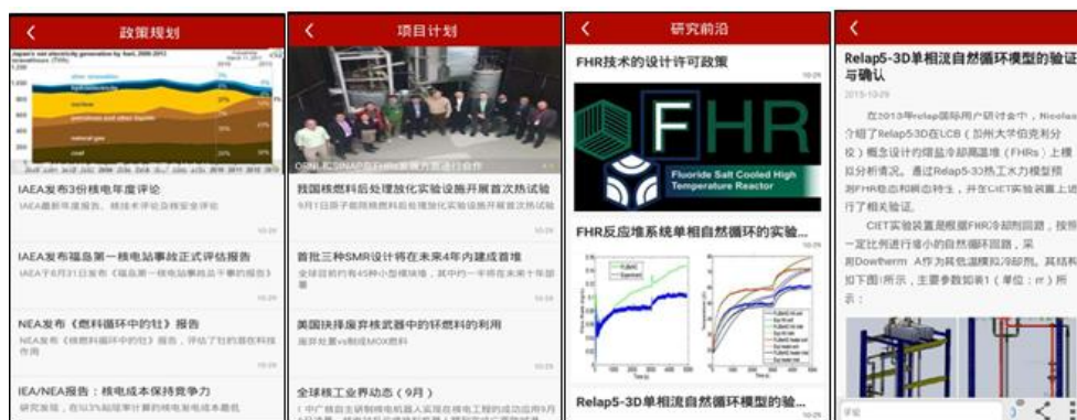
图3 个性化即时学科信息服务

赋与予一定的资源访问权限而得到满足。如研发部门主管可以允许部分研发人员获得与其相同的信息资源访问权限。