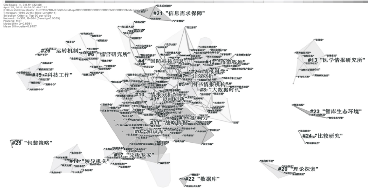
图 3 图情期刊中智库研究的共词聚类分析

2.6 共词聚类分析 共词聚类分析法以能概括文章内容的词汇作为分析对象,通过一系列的统计手段,将具有一定语义联系的词汇聚集起来形成类团,用以表达学科研究结构与研究热点。本文选用具有较高语义概括能力的题目、关键词和摘要(三者合称为主题词)为研究字段,借助 Citespace 分析软件和人工判读方式,对全部文章的主题词进行共词聚类分析,并通过可视化的方式展现出来,如图 3 所示。