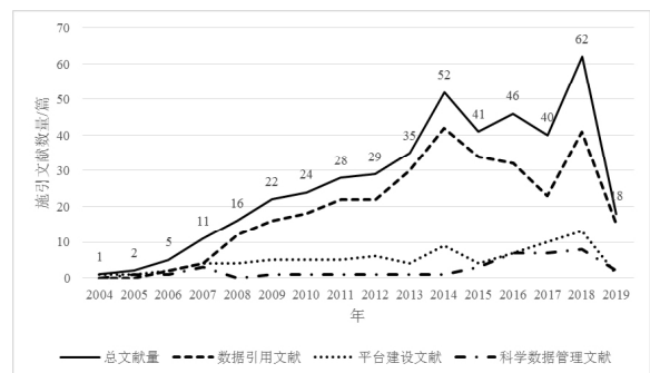
图 1 CNKI 数据库中引用“地震科学数据共享平台”文献的年度分布

CNKI 数据库中从 2004 年开始有文献引用地震平台(2019 年数据量不全,仅做参考),之后每年文献引用次数都在增加,整体上呈现出稳定增长的趋势(图 1)。其中 2014 年文献量有一个很明显的增长,这跟 2011 年底地震平台成为首批获得认定的 23 个国家科技基础条件平台之一有关。